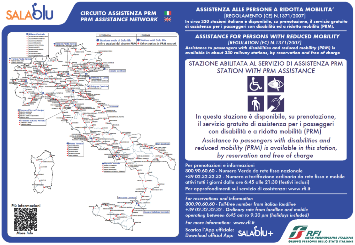
Fig. 2a “Cartello informativo circuito assistenza PRM – stazioni abilitate”